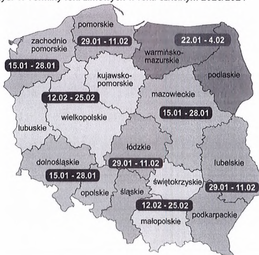
Rys. 1. Terminy ferii zimowych w roku szkolnym 2023/2024

Ferie zimowe w 2024 roku w województwie zachodniopomorskim odbędą się w terminie od 15 stycznia do 28 stycznia 2024 roku.