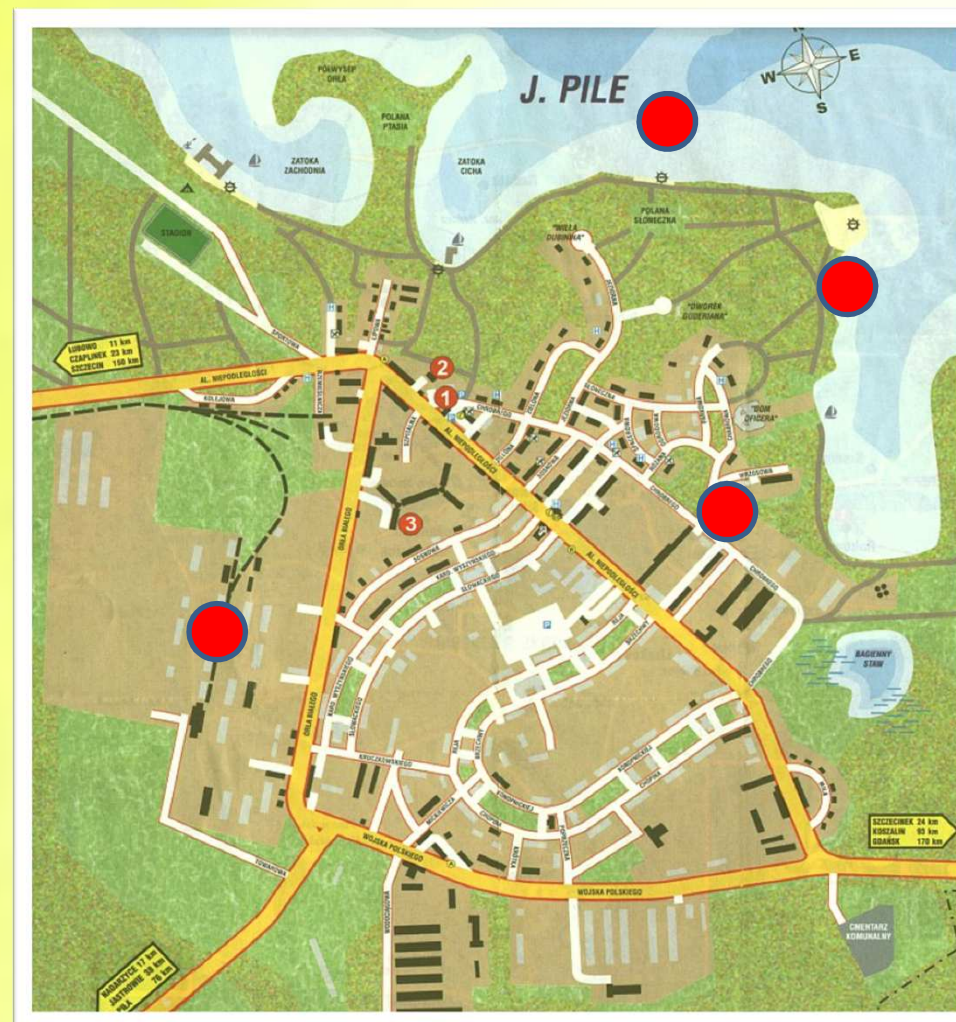
Schemat przedstawia miejsca zagrożenia.

Główne niebezpieczeństwo dla mieszkańców jak i turystów stanowią zagrożenia związane z terenem byłego poligonu (występowanie niewybuchów i niewypałów), zbiorniki wodne.